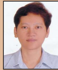
Nguyễn Thị Bình Phó Chủ tịch