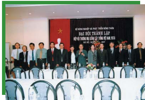
Thành viên Ban chấp hành, Ban Kiểm tra